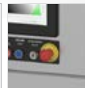
Parada de emergência