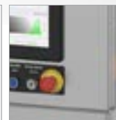
Parada de emergência