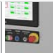
Parada de emergência